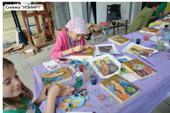
В Националната художествена галерия

Политехническият музей, Природонаучният музей и Софийската градска художествена галерия съвместно с фондация „Изиарт“ организират пролетно училище в периода от 6 до 9 април, по време на пролетната ваканция. Със специално разработена програма трите места в София ще посрещнат деца на възраст между 6 и 12 години, научи ДУМА от Десислава Петрова.