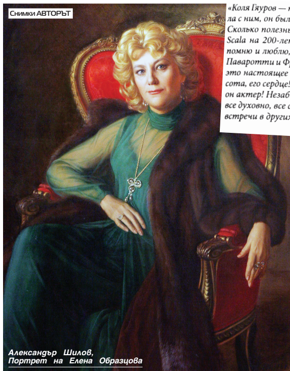
Александър Шилов, Портрет на Елена Образцова